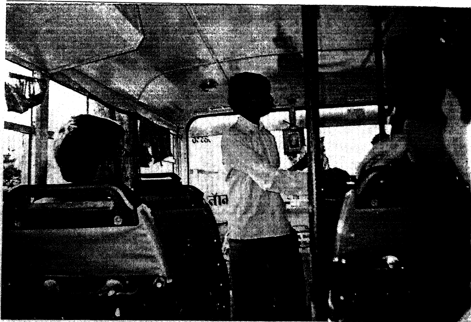
सार्वजनिक स्थान पर पान मसाला बेचता बालश्रमिक